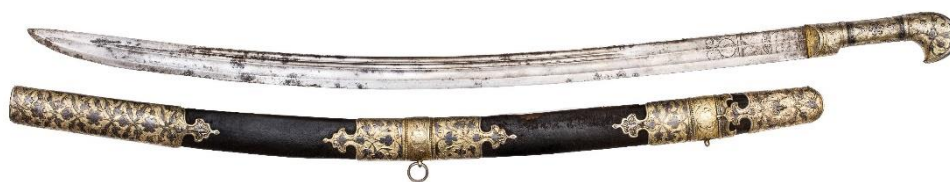
Илл. 3. Общий вид шашки.

Второй клинок с именем казикумухского мастера обнаружен автором при изучении предмета из собственного собрания. Это украшенная офицерская шашка 1863/1864 г. с неутапливаемой в ножны рукоятью (Илл. 3). Общая длина 96 см, длина клинка 79,6 см, ширина клинка 3,3 см. Отметим, что ножны шашки изготовлены одновременно с клинком под соответствующую кривизну с учетом