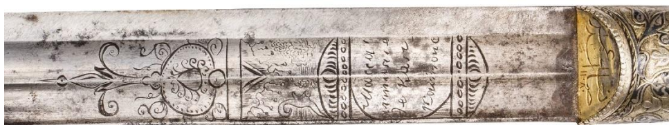
Илл. 4. Картуш на правой стороне клинка.

На пяте клинка с обеих сторон нанесено клеймо в виде картуша, в центре которого расположена надпись на французском языке « Масса l'armurie(r) de Kazi Koumuc(h) » - «Макка, оружейник из Казикумуха» (Илл. 4, 5). На одной из сторон клинка надпись нанесена так, что основания букв направлены в