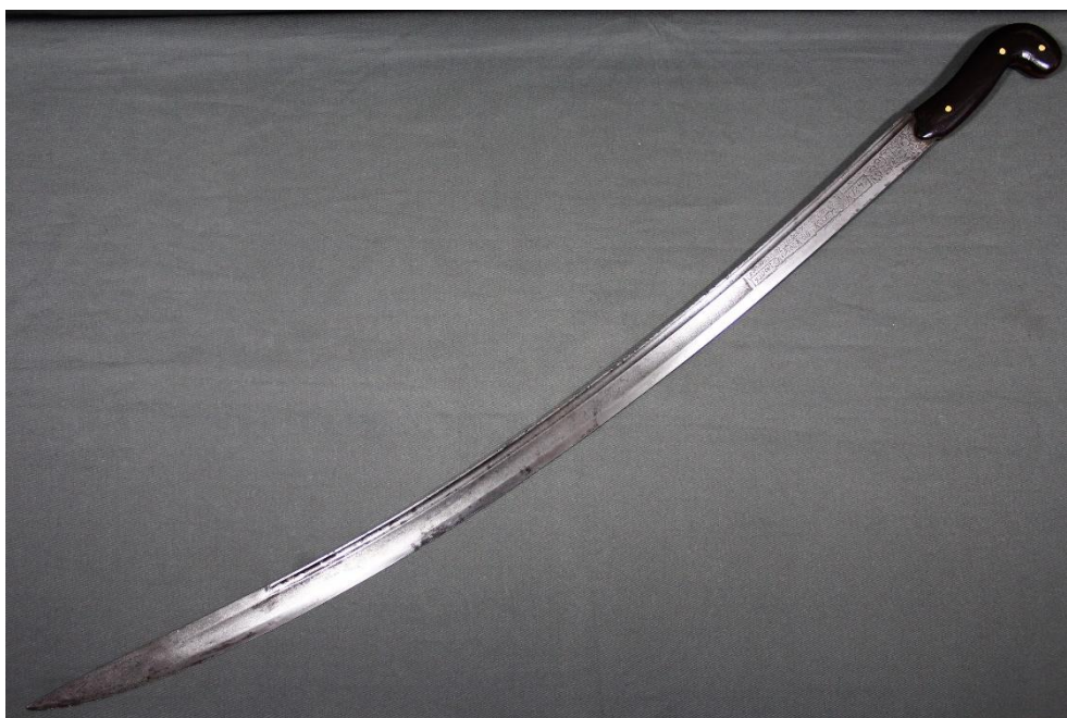
Илл. 1. Клинок сабли.

отрядов наибов Шамиля: «В ночь на 21 (апреля 1856 года) горцы до 2000 человек вторглись со стороны Андалаля в Прикаспийский край, в Казикумухское ханство; г.-м. Агалар-бек атаковал не приятеля и обратил его в бегство» (Хронологический указатель военных действий 1911, 4). Обратим внимание на небрежный стиль надписи в рамке и неровные линии самой рамки. В связи с этим необходимо отметить, что для клинкового оружия дагестанского производства характерна некоторая неаккуратность в нанесении изображений и надписей на языках, отличных от арабского. Так, даже на клинках начала XX века, произведенных казикумухскими мастерами в столице Терской области Владикавказе, где уровень грамотности и художественного вкуса среди оружейников должен был быть выше, чем в Кази-Кумухе в середине XIX века, мы встречаем клейма и картуши с неровными буквами и орфографическими ошибками. Как пример, в альбоме «Холодное оружие в собрания Российского этнографического музея» опубликована шашка (РЭМ №8761 - 15765) (Холодное оружие в собрания Российского этнографического музея 2006, 39) с клинком производства мастер-