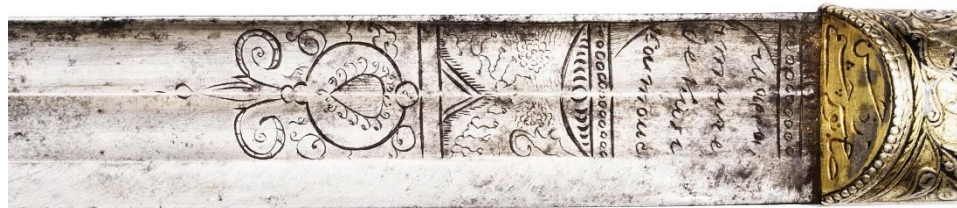
Илл. 5. Картуш на левой стороне клинка.

сторону боевого конца клинка, на другой - в сторону рукояти. Клинок имеет широкую режущую кромку и два широких дола, верхний широкий дол на некотором расстоянии от картуша с клеймом делится на два узких. Очевидно, что форма картуша была заимствована мастером. Подобные картуши с надписями на французском языке мы встречаем на клинках европейского производства XVIII века. В Музее артиллерии (ВИМАИВиВС) хранится шашка (Инв.№117/190. Кн.№17135) (Кулинский 2011, 30,31), на клинке которой изображен картуш формы, вероятно ставшей прототипом для картуша казикумухского мастера (Илл. 6).