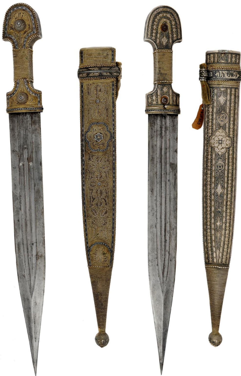
Илл. 5. Кинжал с ножнами. 1916 год. Кутаисский государственный исторический музей.