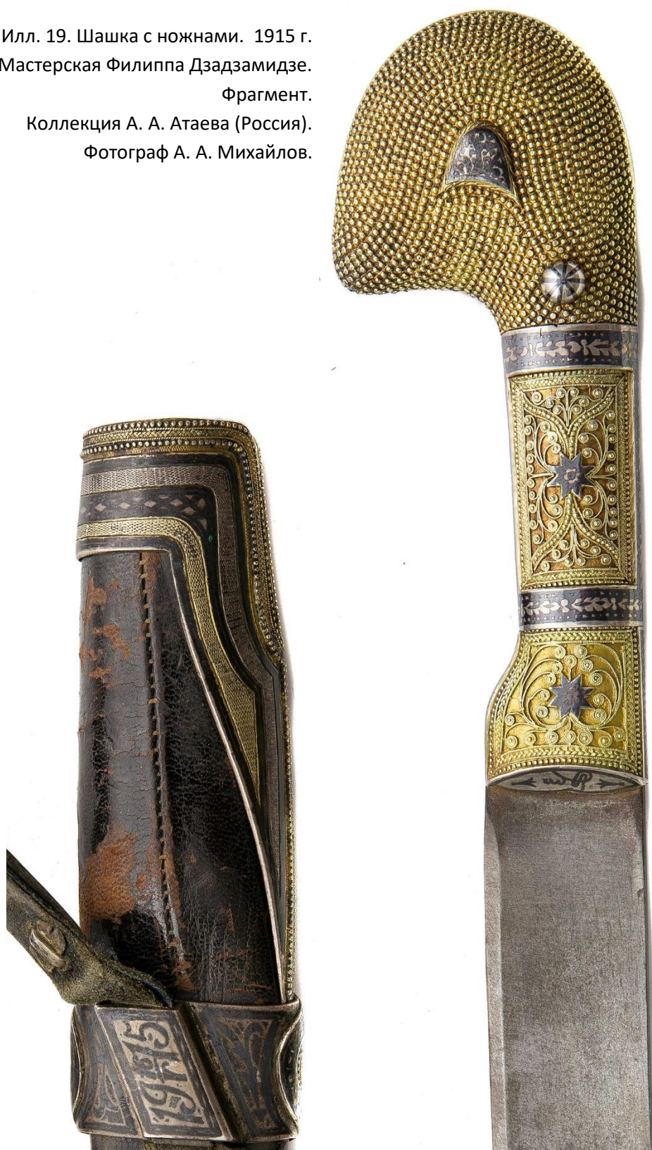
Илл. 19. Шашка с ножнами. 1915 г. Мастерская Филиппа Дзадзамидзе. Фрагмент. Коллекция А. А. Атаева (Россия). Фотограф А. А. Михайлов.