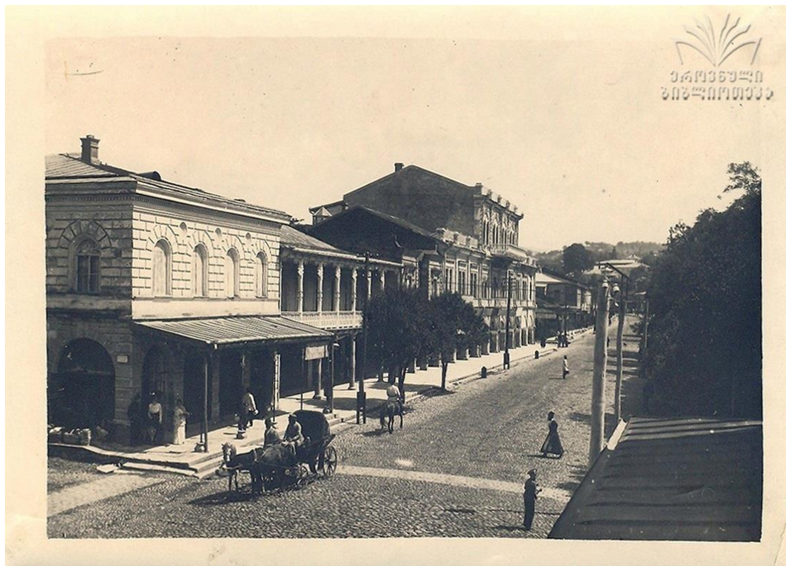
Илл. 7. Кутаиси. Михайловская улица (современный ул. З. Палиашвили). Конец XIX века. Национальная парламентская библиотека Грузии.

Искусство мастеров, работавших в западногрузинском стиле, отличается большой эклектикой. Несмотря на то, что существовали каноны, которые соблюдались всеми мастерами (например, филигранью украшалась только лицевая часть ножен кинжала или жирницы, на нижней части ножен и на рукояти кинжала должна быть намотана проволока, конец проволоки в орнаментах заканчивается зернью и т. д.), мастера старались быть свободными в деталях отделки и орнамента. К примеру, на жирницах, изготовленных в период Грузинской Демократической Республики (1918-1921 гг.), часто встречаются изображения с портретом грузинского поэта XII века Шота Руставели, герба Республики и др.