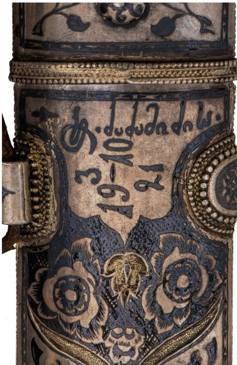
Илл. 38. Кинжал с ножнами. 1910 год. Мастерская Филиппа Дзадзамидзе. Фрагмент. Коллекция А. Н. Хелая (Россия).