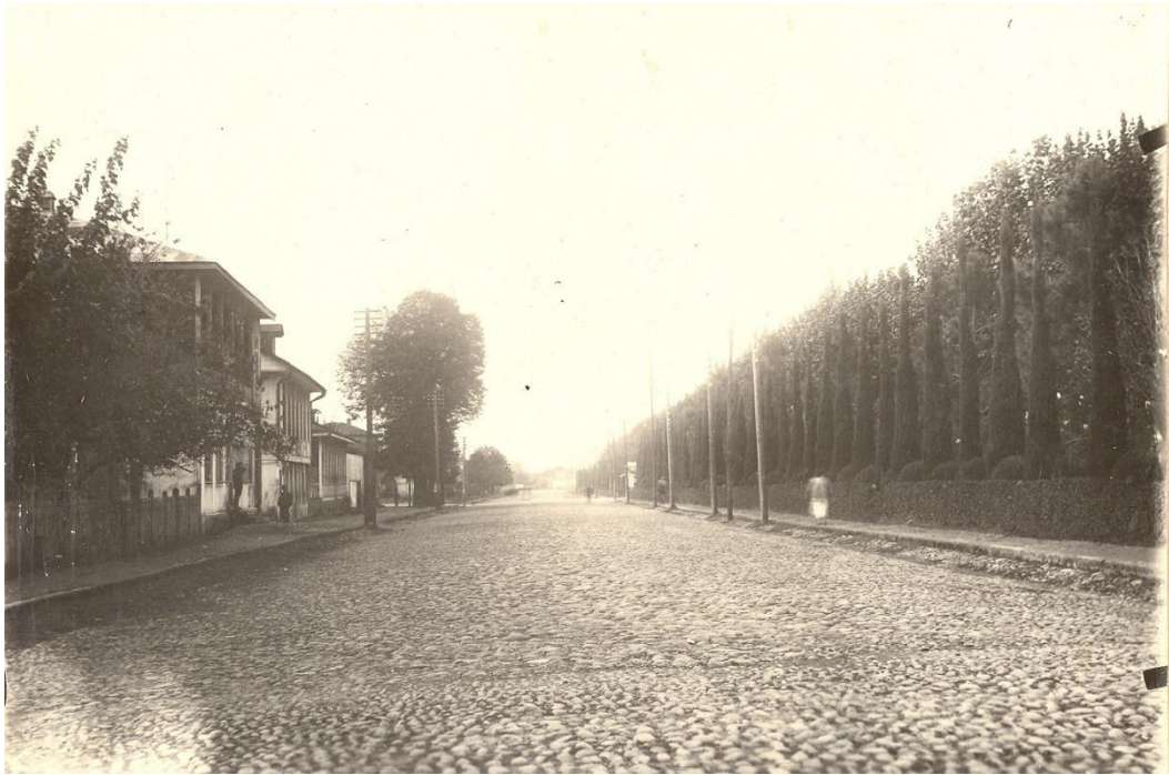
Илл. 45. Зугдиди. Улица Сталина. Первая половина XX века. Национальная парламентская библиотека Грузии.