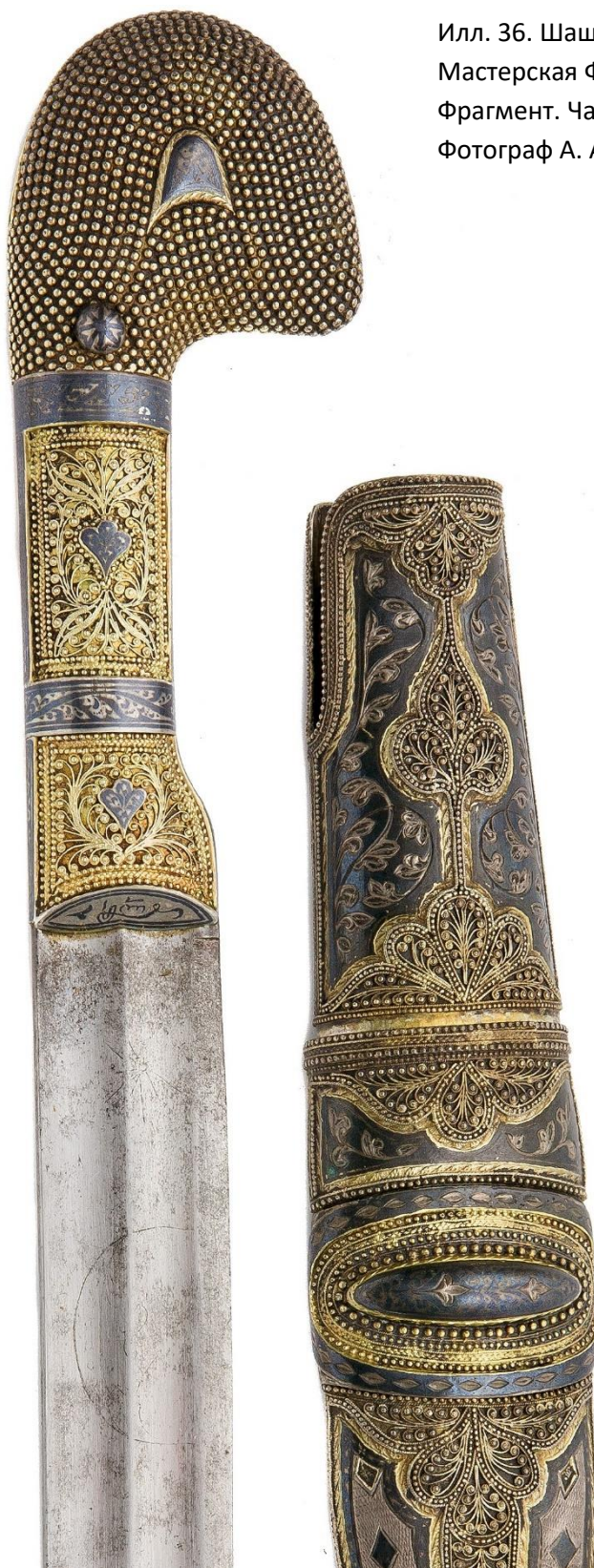
Илл. 36. Шашка с ножнами. 1915 г. Мастерская Филиппа Дзадзамидзе. Фрагмент. Частная коллекция.