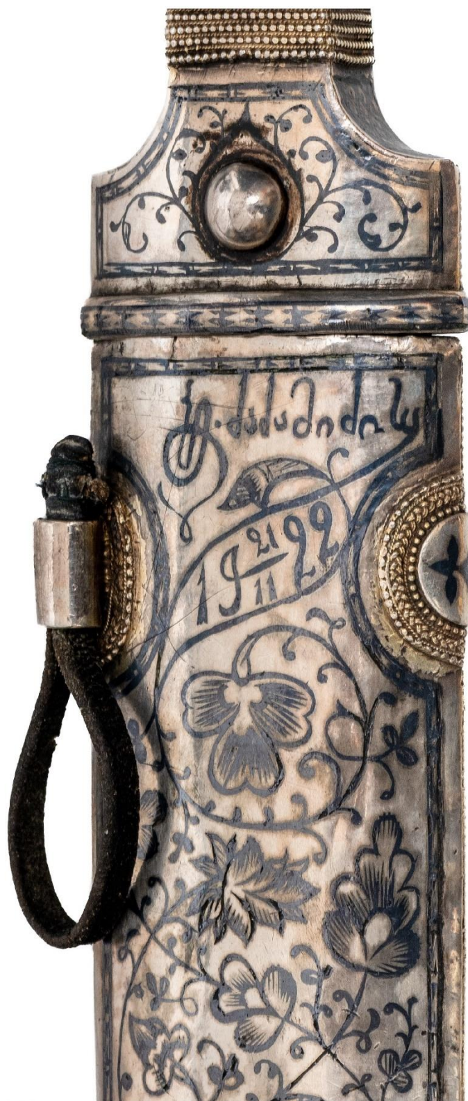
Илл. 27. Кинжал с ножнами. 1922 год. Мастерская Филиппа Дзадзамидзе. Фрагмент. Коллекция А. Н. Хелая (Россия).