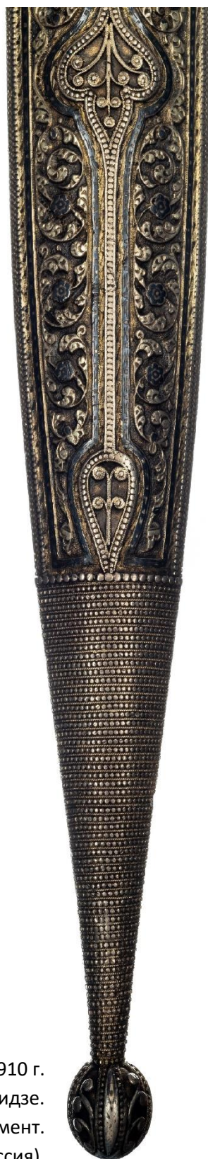
Илл. 39. Кинжал с ножнами. 1910 г. Мастерская Филиппа Дзадзамидзе. Фрагмент. Коллекция А. Н. Хелая (Россия).