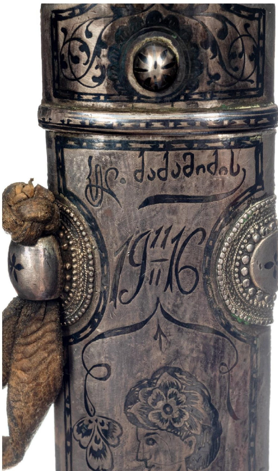
Илл. 32. Кинжал с ножнами. 1916 год. Мастерская Филиппа Дзадзамидзе. Фрагмент. Коллекция А. Н. Хелая (Россия).