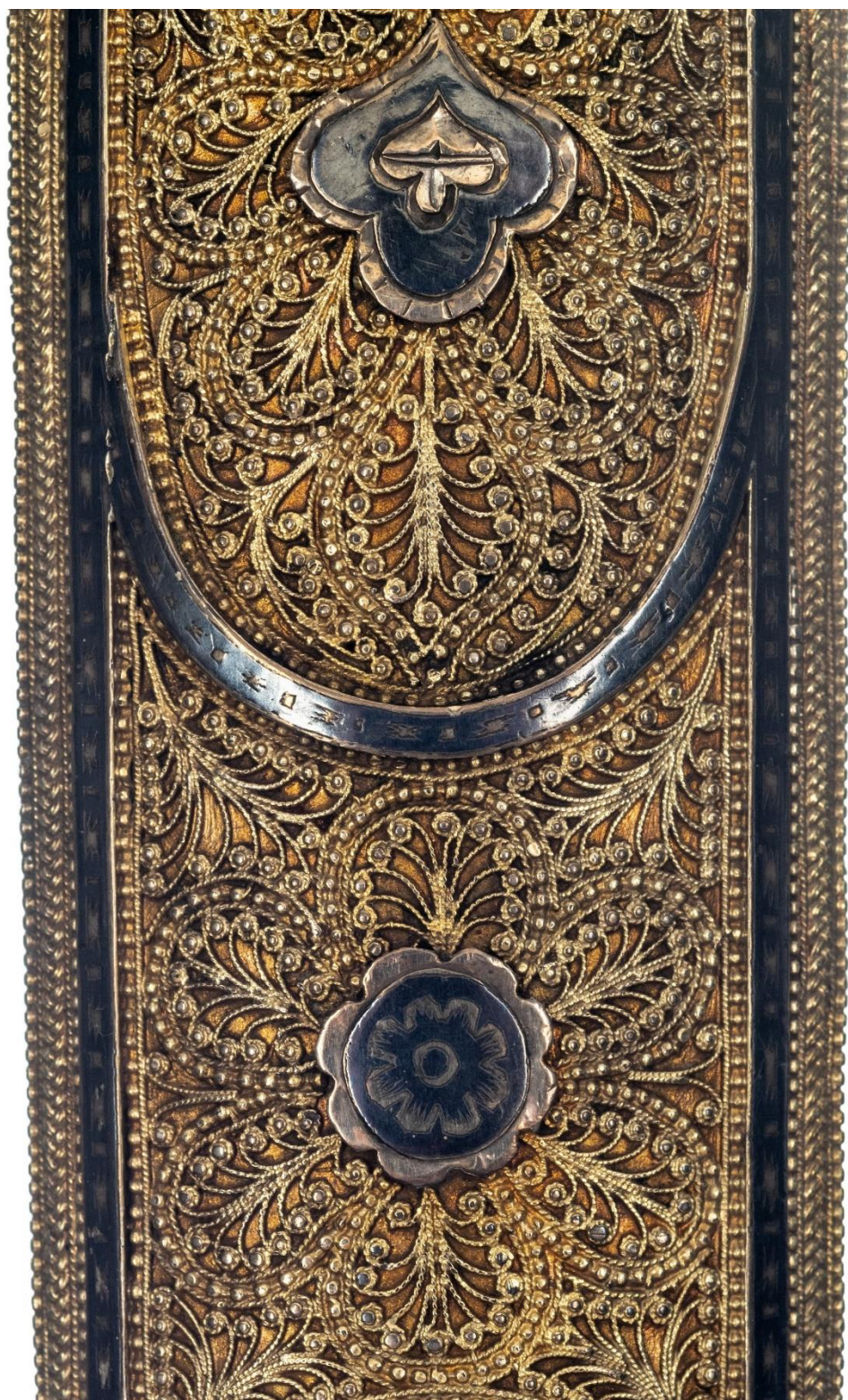
Илл. 29. Кинжал с ножнами. 1922 год. Мастерская Филиппа Дзадзамидзе. Фрагмент. Коллекция А. Н. Хелая (Россия).