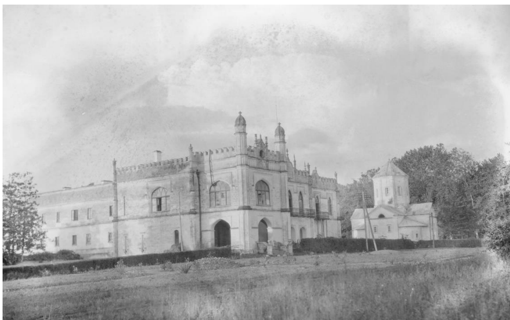
Илл. 12. Зугдиди. Дворец Екатерины Дадiani (Чавчавадзе). Фотография, начало XX века.

Кроме постоянно функционировавших торгово-ремесленных поселков, в первой половине XIX века большое значение в экономике региона играли периодически устраиваемые базары ярмарочного типа, в частности те, которые проводились каждую пятницу. Такие еженедельные мероприятия вызывали приток большого количества посетителей, что создавало благоприятные условия для сбыта различной продукции, произведенной местными мастерами (Iobashvili 1983, 77-82). Несмотря на то, что с 50-х годов XIX столетия такие ярмарки постепенно теряли актуальность, они оставались местами, где широко продавалось оружие, украшенное местными златокузнецами. Например, пристав полиции Зугдидского уезда Павел Семенов 6 в 1872 году писал так: «Бывают сборы в местечке Зугдиды, куда два раза в неделю, и именно в базарные дни, стекается до 800-ть и больше душ народу. Во время базарных дней мингрельцы продают за наличные деньги разного рода птицу, овец, местный табак, глиняную посуду местной выделки,