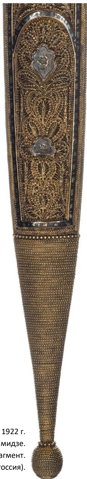
Илл. 28. Кинжал с ножнами. 1922 г. Мастерская Филиппа Дзадзамидзе. Фрагмент. Коллекция А. Н. Хелая (Россия).