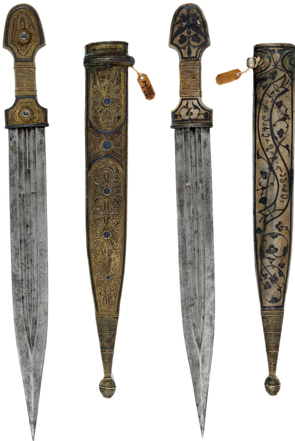
Илл. 6. Кинжал с ножнами. 1910-1920 гг. Кутаисский государственный исторический музей.