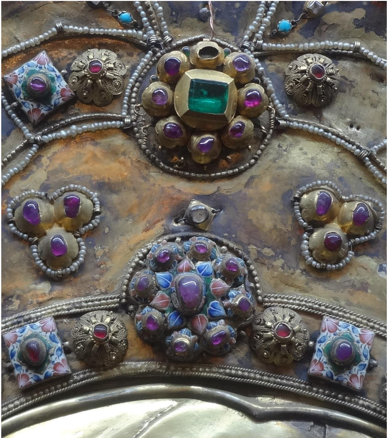
Илл. 4. Икона Пресвятой Богородицы Палиастомская (Кутаисская). Фрагмент. XVIII-XIX вв. Кутаисский государственный исторический музей.