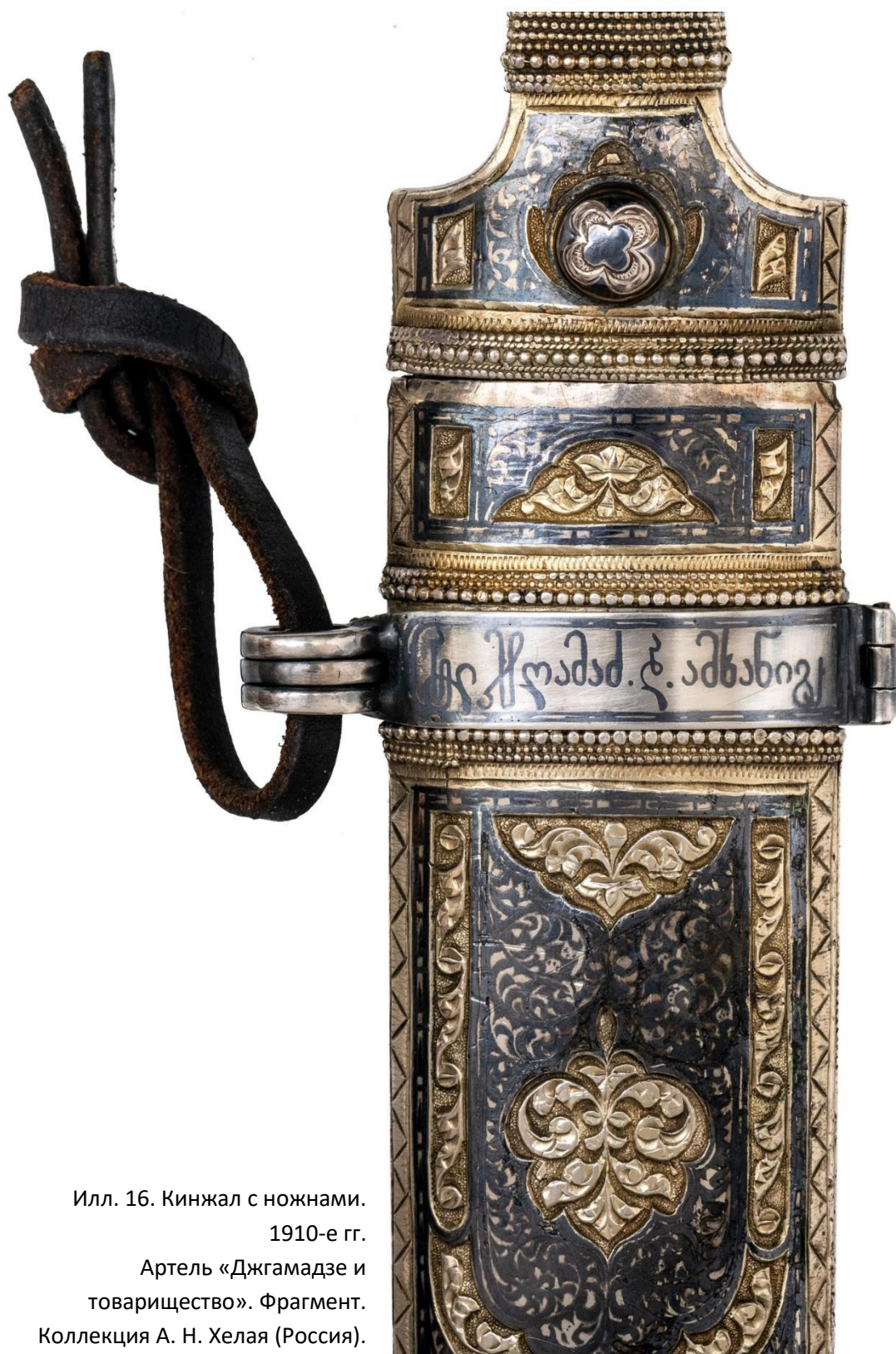
Илл. 16. Кинжал с ножнами. 1910-е гг. Артель «Джгамадзе и товарищество». Фрагмент. Коллекция А. Н. Хелая (Россия).