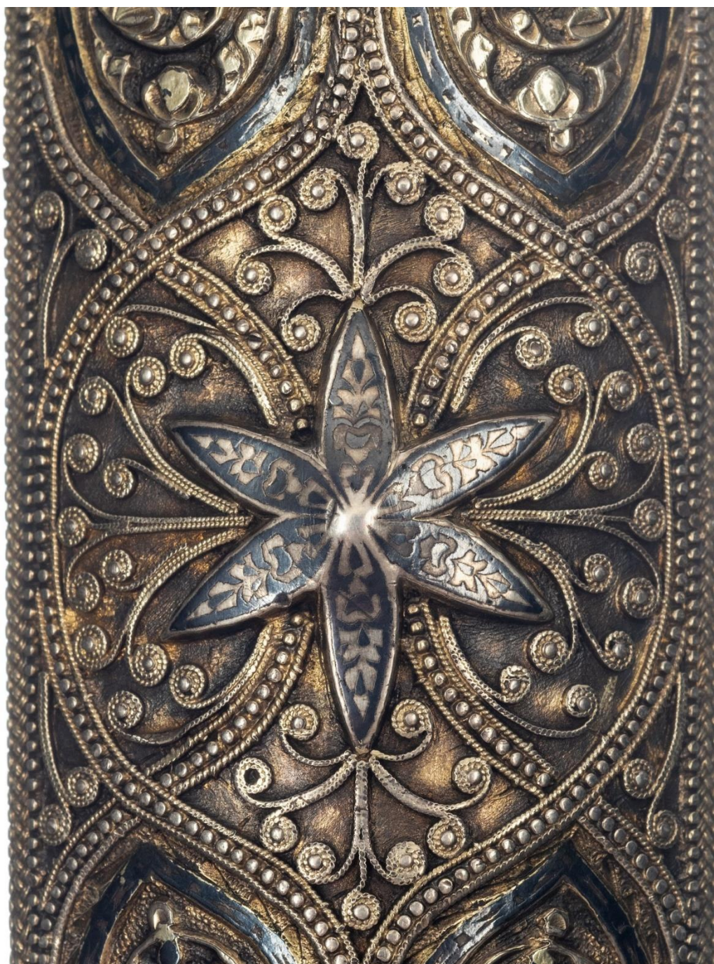
Илл. 40. Кинжал с ножнами. 1910 год. Мастерская Филиппа Дзадзамидзе. Фрагмент. Коллекция А. Н. Хелая (Россия).