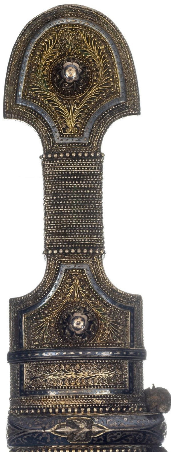
Илл. 31. Кинжал с ножнами. 1916 год. Мастерская Филиппа Дзадзамидзе. Фрагмент. Коллекция А. Н. Хелая (Россия).