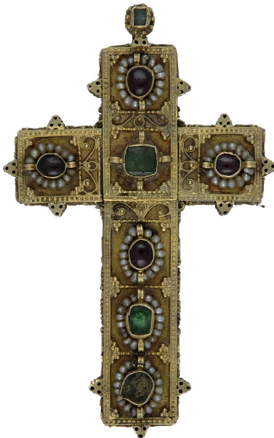
Илл. 1. Крест из Кутаиси, XVI век. Кутаисский государственный исторический музей.