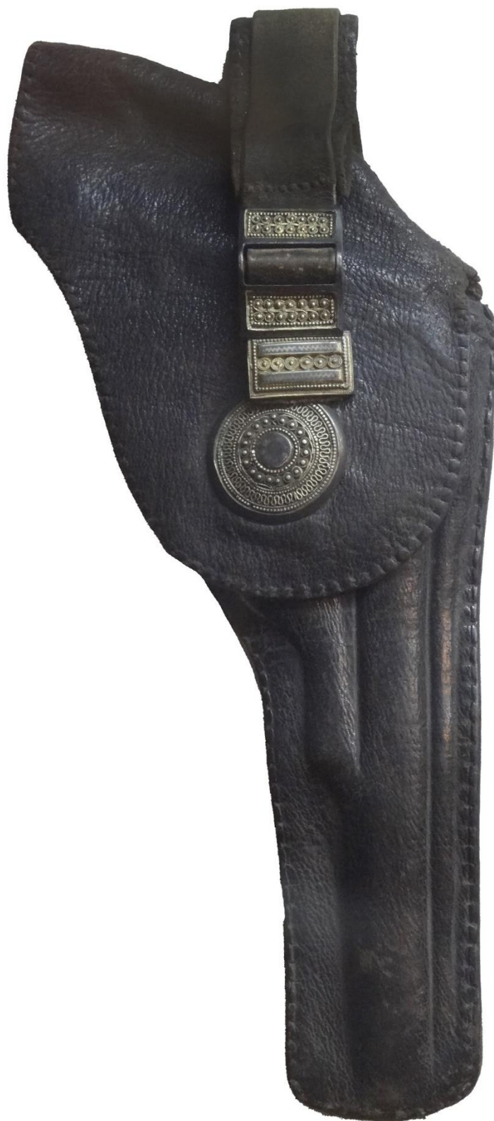
Илл. 8. Кобура для пистолета. Первая треть XX века. Кутаисский государственный исторический музей.