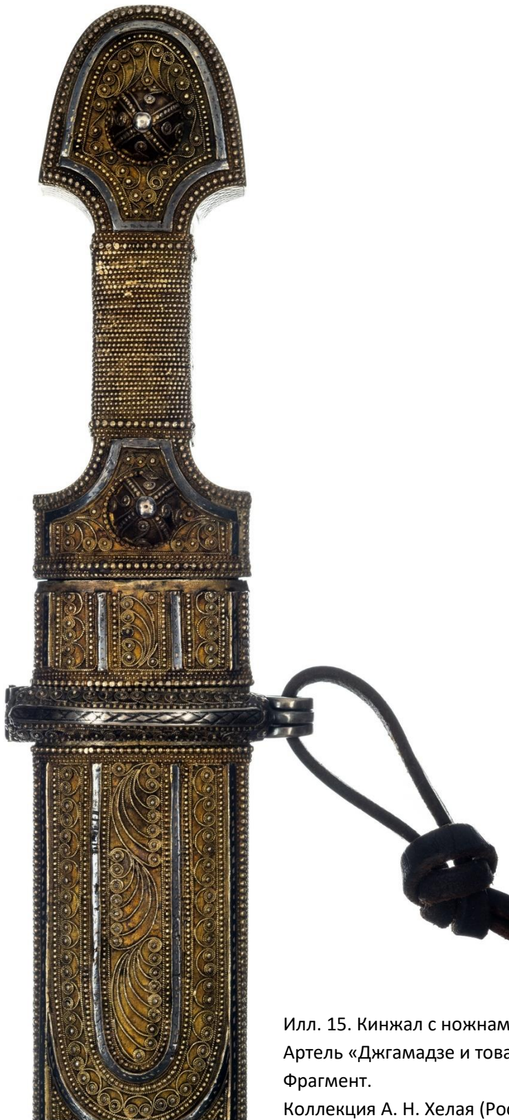
Илл. 15. Кинжал с ножнами. 1910-е гг. Артель «Джгмадзе и товарищество». Фрагмент. Коллекция А. Н. Хелая (Россия).