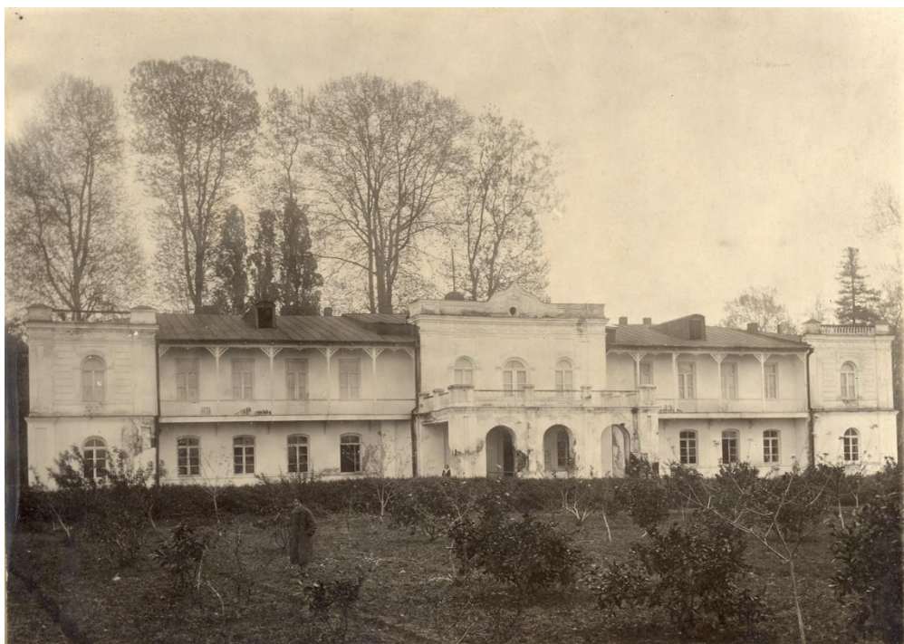
Илл. 11. Зугдиди. Дворец Нико Дадияни. Фотография, конец XIX века. Национальная парламентская библиотека Грузии.