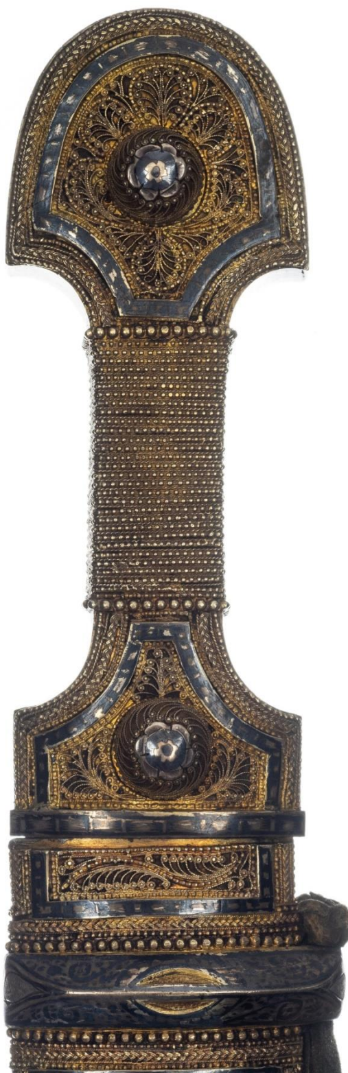
Илл. 42. Кинжал с ножнами. 1935 год. Мастерская Филиппа Дзадзамидзе. Фрагмент. Коллекция А. Н. Хелая (Россия).