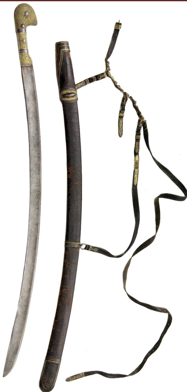
Илл. 18. Шашка с ножнами. 1915 год. Мастерская Филиппа Дзадзамидзе. Коллекция А. А. Атаева (Россия).