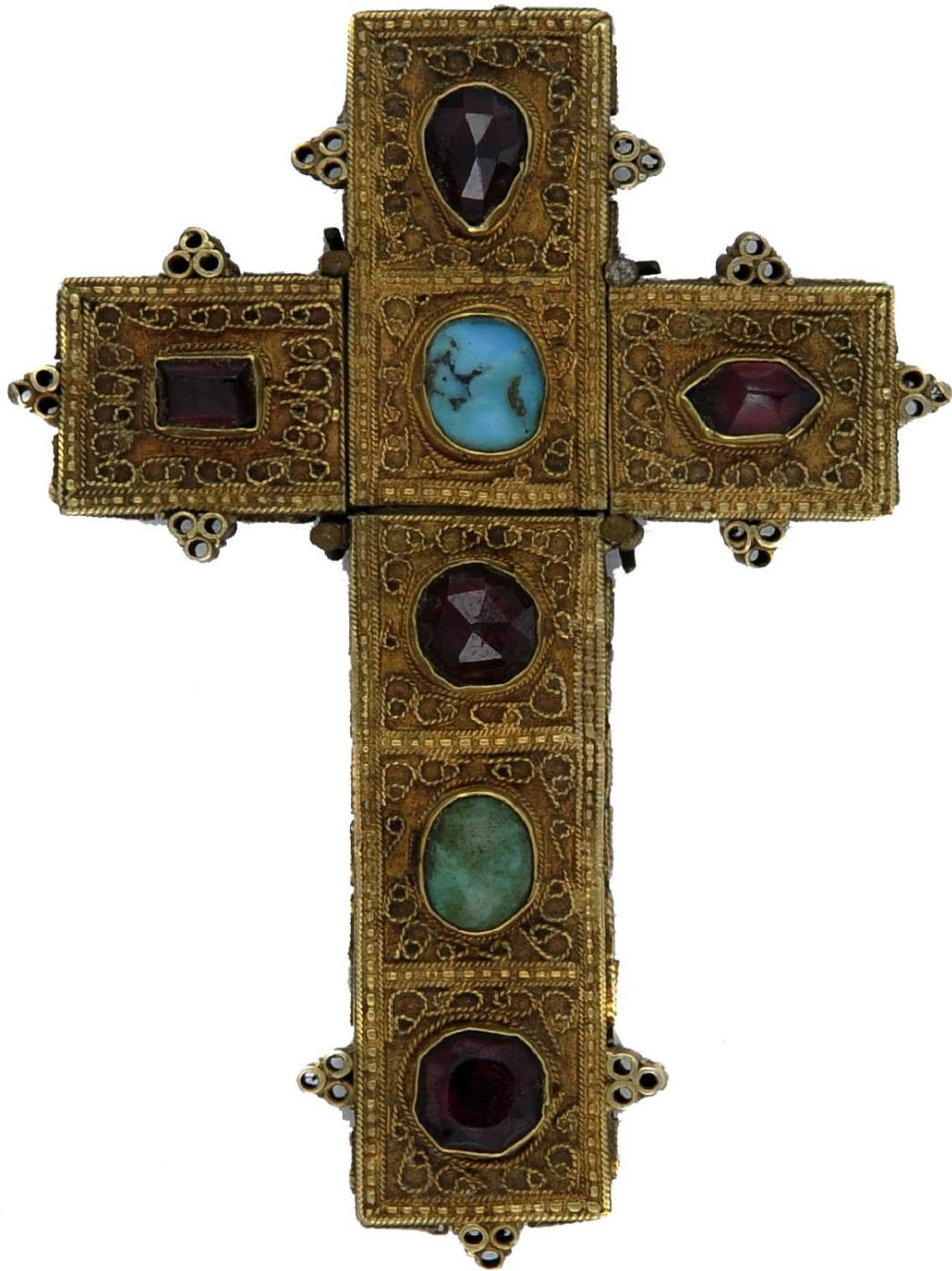
Илл. 2. Крест из Верхнего Вани, XVI век. Кутаисский государственный исторический музей.