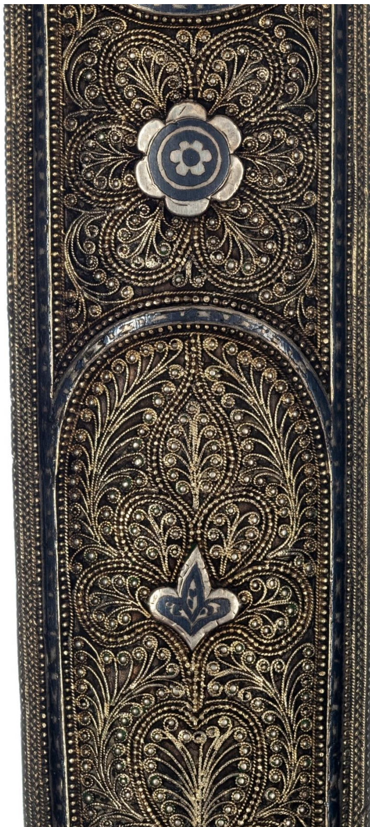
Илл. 33. Кинжал с ножнами. 1916 год. Мастерская Филиппа Дзадзамидзе. Фрагмент. Коллекция А. Н. Хелая (Россия).