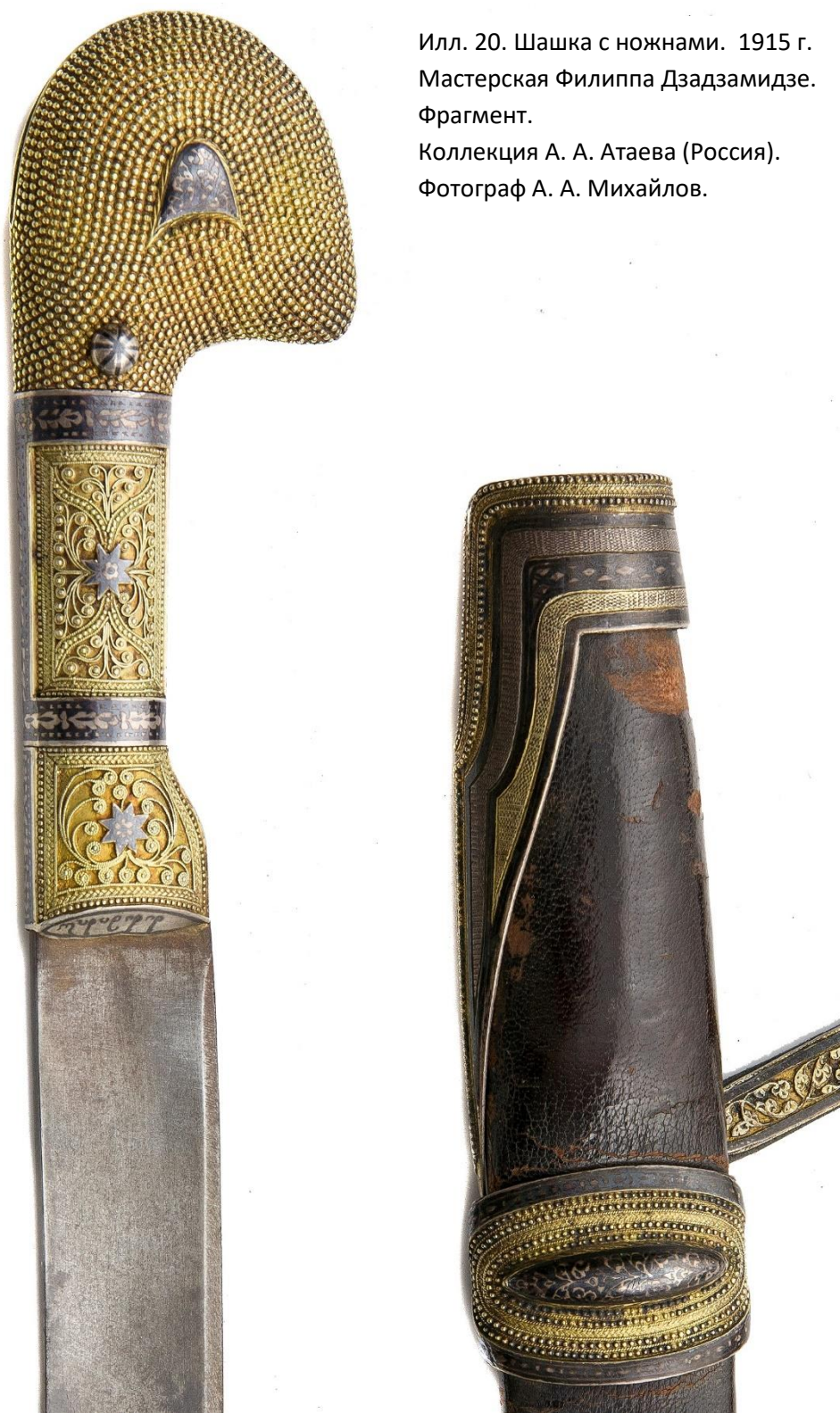
Илл. 20. Шашка с ножнами. 1915 г. Мастерская Филиппа Дзадзамидзе. Фрагмент. Коллекция А. А. Атаева (Россия).