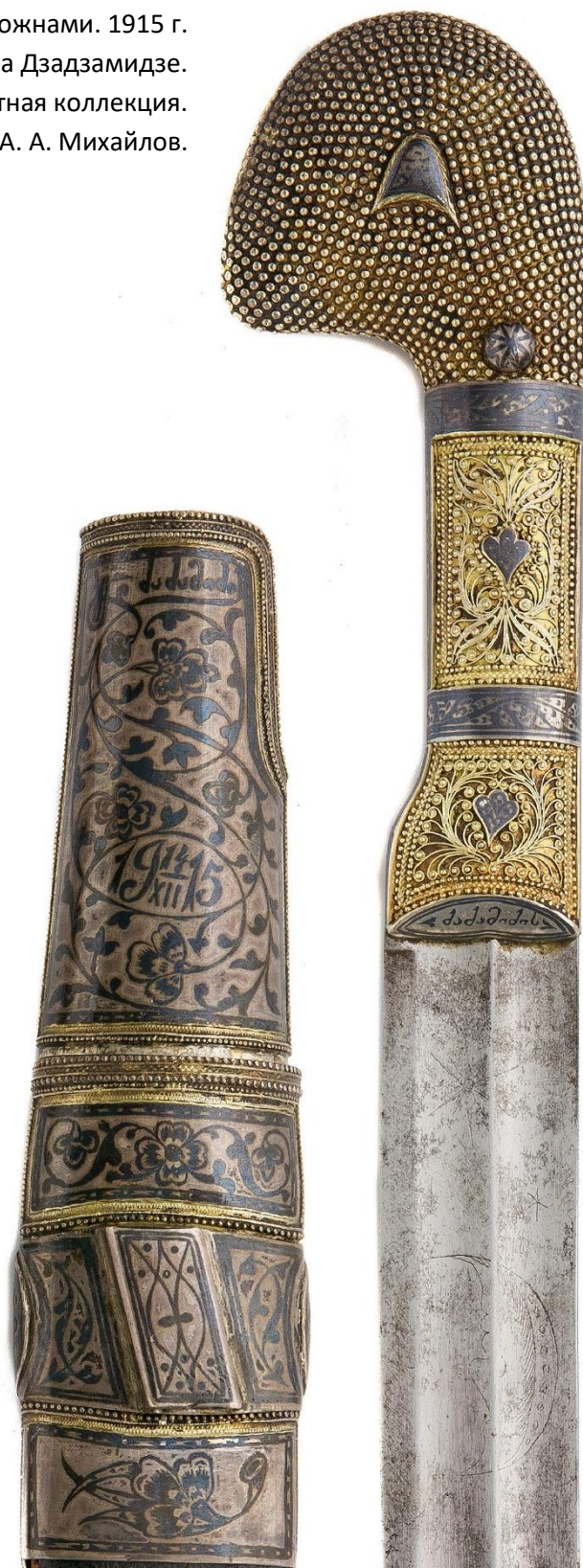
Илл. 35. Шашка с ножнами. 1915 г. Мастерская Филиппа Дзадзамидзе. Фрагмент. Частная коллекция.