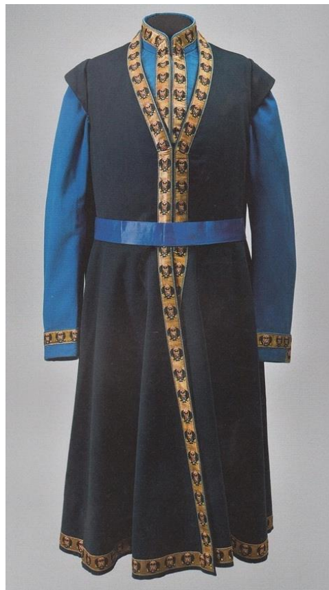
Рис. 6. Повседневный костюм камер-казака.