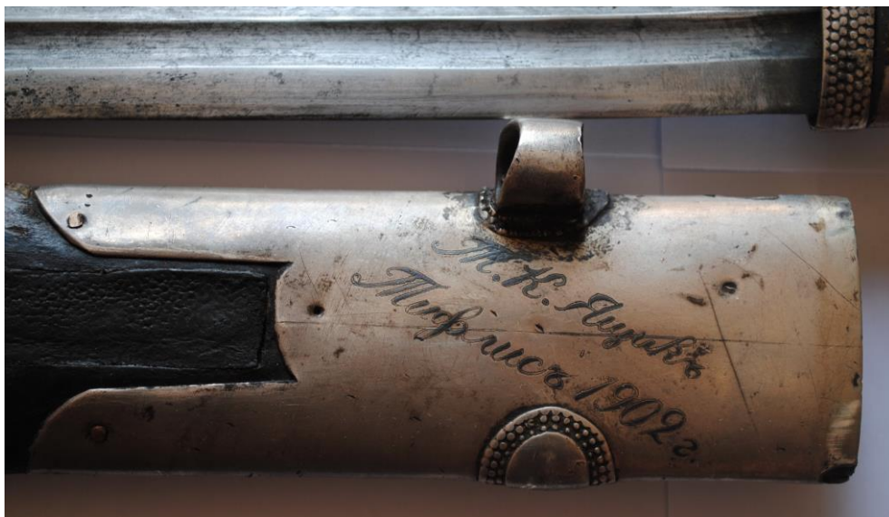
Рис. 2. Надпись на устье ножен.

уходят под заднюю щечку рукояти. Ножны изготовлены из дерева, покрыты кожей; прибор ножен, состоящий из устья и наконечника, изготовлен из серебра, украшенного в технике гладкой черни. На лицевой стороне рукояти расположена накладка из серебра, хвостовик клинка между щечек рукояти, изготовленных из рога, закреплен тремя заклепками с серебряными шляпками. Клейм на серебре нет. Общая длина кинжала 55,4 см, длина клинка 37 см, ширина клинка у основания 4 см. На устье ножен с задней стороны имеется надпись «Т.К.Ящикъ Тифлисъ 1902 г.», выполненная чернью (рис.2). Подлинность кинжала и надписи сомнений не вызывает.