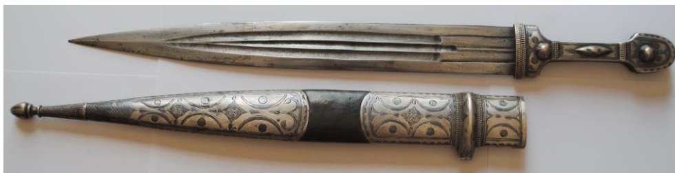
Рис. 1. Кинжал. Общий вид.

В конце 2015 года автору удалось найти и приобрести кинжал кавказский типа «кама» в ножнах с надписью на устье (рис.1). Клинок кинжала стальной, трехдольный, доли клинка украшены примитивным растительным орнаментом, выполненным травлением. С лицевой стороны клинка доли не доходят до рукояти, образуя пята, с обратной стороны клинка доли доходят до рукояти и