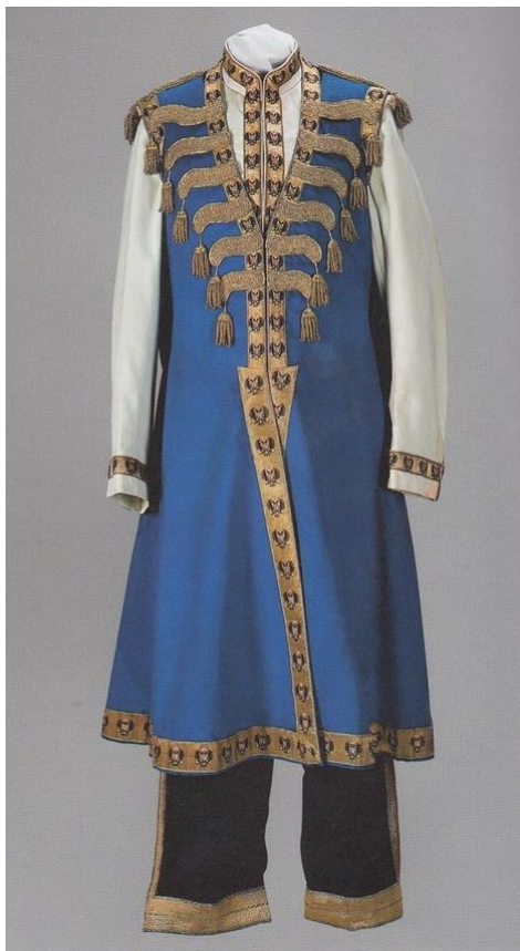
Рис. 5. Парадный костюм камер-казака.