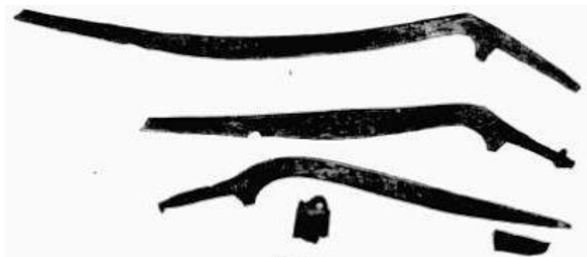
Иллюстрация к «Сабельному этюду».