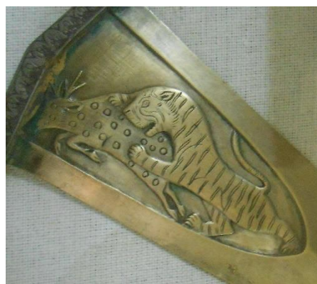
Рис. 4. Джамдхар.