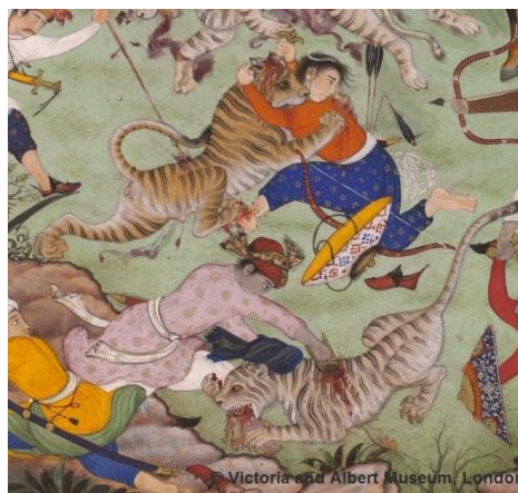
Рис. 2. Акбар-нама. 1586-1589. Victoria and Albert Museum, IS.2:17-1896

охотник-лучник, на которого набросился один из тигров, не готовился к ближнему бою с ним. Бросив лук, он пытается защищаться обычным кинжалом, с тоской смотря в сторону и нанося бесполезные удары в крепкий череп животного. Охотник, вступивший в поединок с другим хищником, явно был подготовлен специально для такого боя. Он не имеет стрелкового оружия, его левая рука обмотана тканью, и он целенаправленно наносит удар под левую лопатку животного. В руке у этого охотника – джамдхар (Рис. 2).