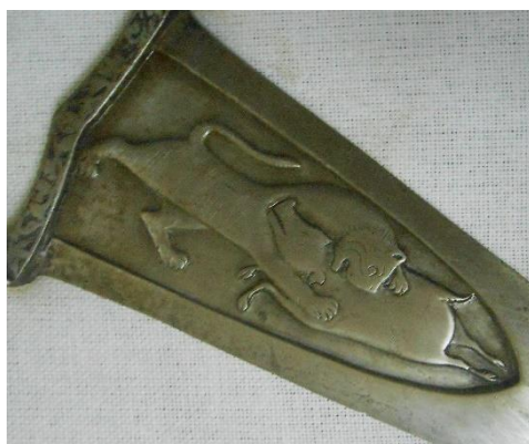
Рис. 3. Джамдхар. Фотография автора

Количество охот, в которых участвовали аристократы в Индии, даже в 16-18 вв. на порядок превышало количество битв, в которых они принимали участие. Естественно предположить, что кинжал, вошедший в комплекс вооружения могольского аристократа первоначально как предмет, традиционный в покоренном Хиндустане для использования на охоте, впоследствии стал использоваться также для ношения в повседневной жизни и в баталиях. В связи с этим стоит обратить внимание на частый мотив в декорировании кинжалов-джамдхар, когда запечатлены не сцены охоты людей на животных, а сцены нападения хищника на добычу (Рис. 3, 4). Вероятно, имела место аллюзия на то, что воин, побеждавший ранее тигра, сам становится подобным тигру, а его противники - подобны жертве и добыче. Возможно, что подобные сцены являлись аналогом батальных сцен, чем и объясняется отсутствие последних в декорировании кинжалов-джамдхар. Предмет со столь богатым набором культурных ассоциаций, пусть даже относящийся к культуре побеждённых, имел все шансы занять достойное место в культуре победителей.